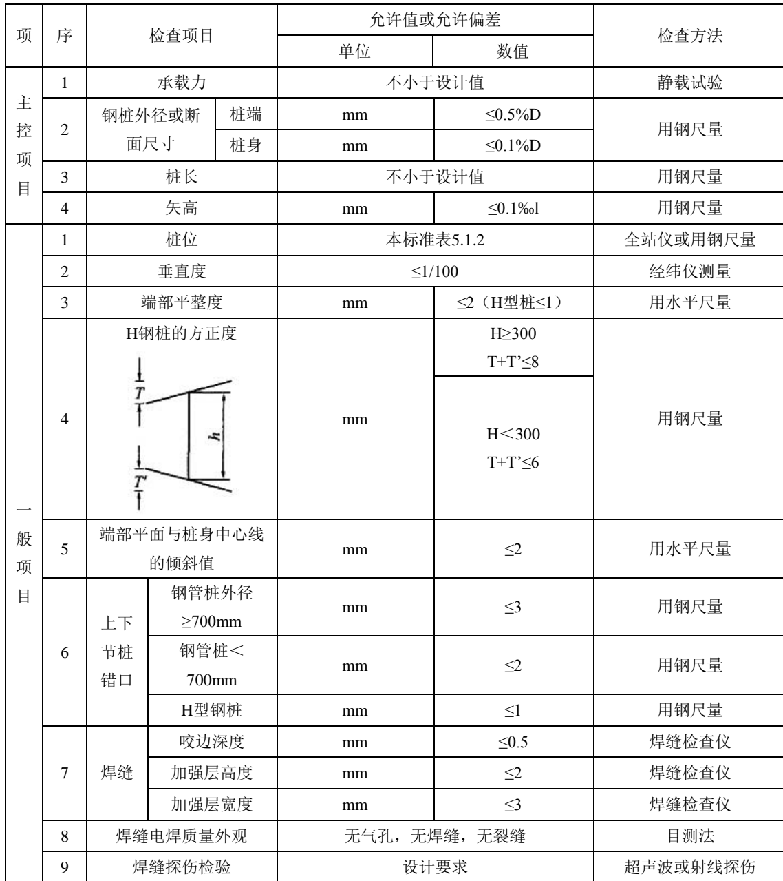
表 5.10.4 钢桩施工质量检验标准

5.10.4 钢桩施工质量检验标准应符合本标准表 5.1.2、表 5.10.4 的规定。